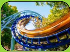
Freier Eintritt in Partner Freizeitparks