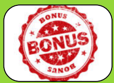
Anwesenheitsprämie (wird zum Vertragsende ausbezahlt)