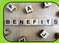
Rabattcodes über die Coperate Benefits Plattform