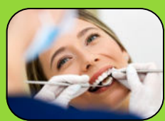
Betriebliche Gesundheitsvorsorge (ab 1 Jahr Betriebszugehörigkeit)