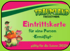
Tickets zu tollen Konditionen für Familie und Freunde