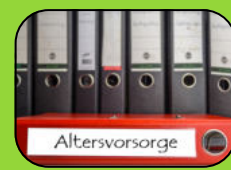
Betriebliche Altersvorsorge 50,- € pro Monat (ab 1 Jahr Betriebszugehörigkeit)