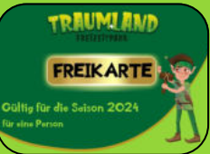
Freikarten für unseren Freizeitpark