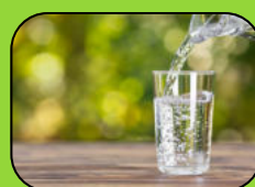
Wasser gibt es GRATIS!