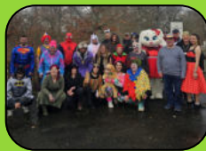
Viele tolle Events (Chefs grillen, Weihnachtsfeier, Ausflüge)